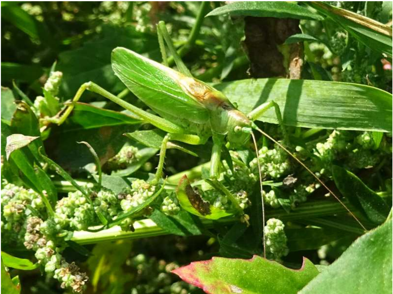
16 juli 2016: Kleine Groene Sabelsprinkhaan (man) op jullie erf

Nog bedankt dat ik even het hek over kon om zekerheid te krijgen en onderstaande foto te maken. De sprinkhanen die ik 16 juli aantrof op jullie bloemenweitje waren kleine groene sabelsprinkhanen; een heel andere soort dan de veel talrijkere grote groene sabelsprinkhaan (die daar ook met enkele exemplaren voorkomt) . Ik meende een dag eerder nog een derde soort sabelsprinkhaan te horen, maar dat bleek dus fout te zijn. Exemplaren in de schaduw zijn kouder en daardoor langzamer met ratelen dan de exemplaren die in de zon zitten, waardoor ik even op het verkeerde been werd gezet.